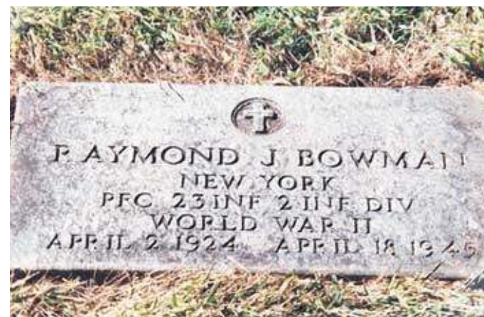
Die heutige Grabstätte des Opfers auf einem Friedhof in seiner Heimatstadt Rochester im US-Bundesstaat New York.