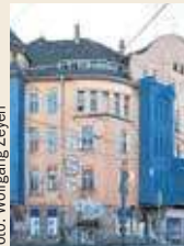
Das Haus Jahnallee 61